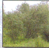
Salice Ripaiolo Salix Elaeagnos