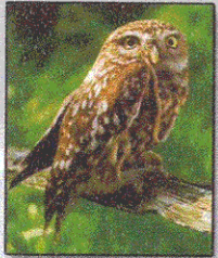
Civetta Athene Noctua