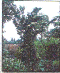
Sambuco Sambucus Nigra