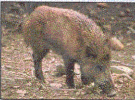
Cinghiale Sus Scrofa