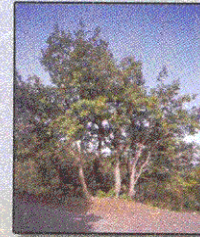
Roverella Quercus Pubescens