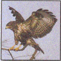
Poiana Buteo Buteo