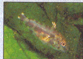
Avannotto di Trota Salmo Trutta Trutta