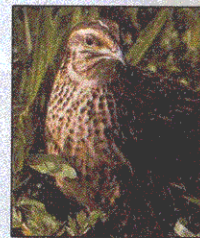
Quaglia Coturnix Coturnix