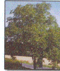
Noce Nostrano Juglans Regia