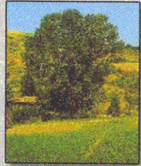
Pioppo Nero Populus Nigra